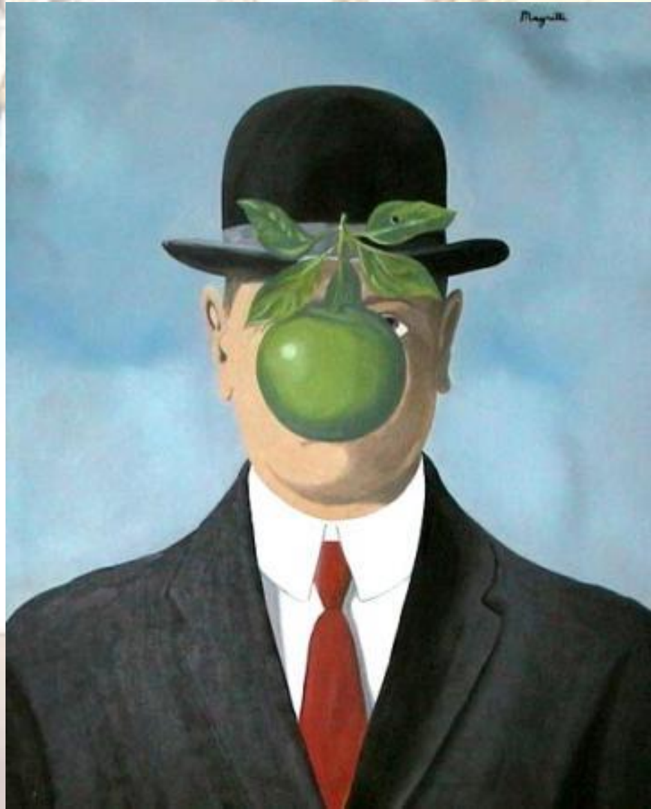
El Hijo del Hombre