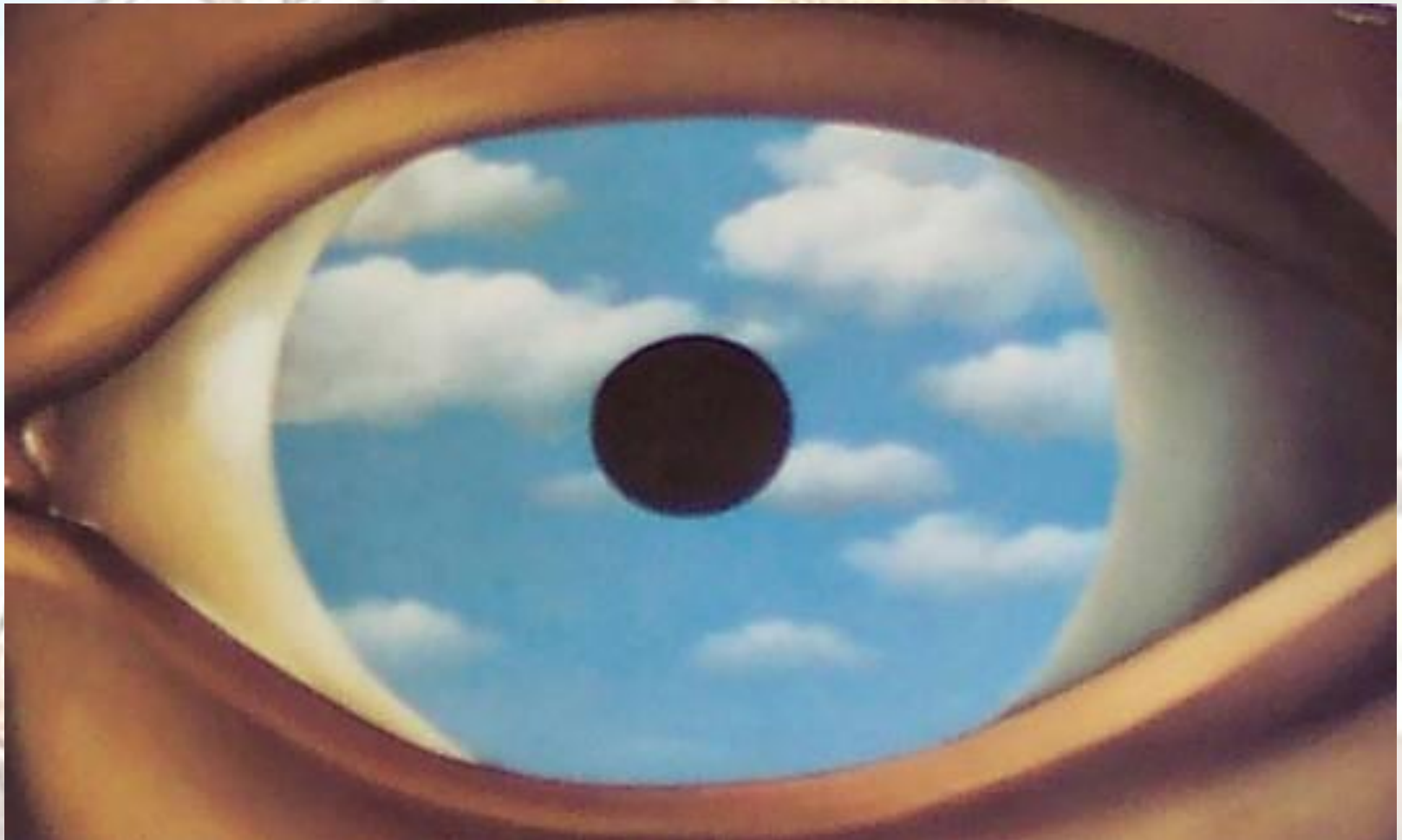
The Fake Mirror