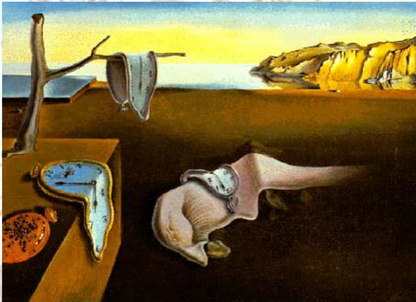
A persistência da memória - Salvador Dalí Museu de Arte Moderna, Nova York - (XX)