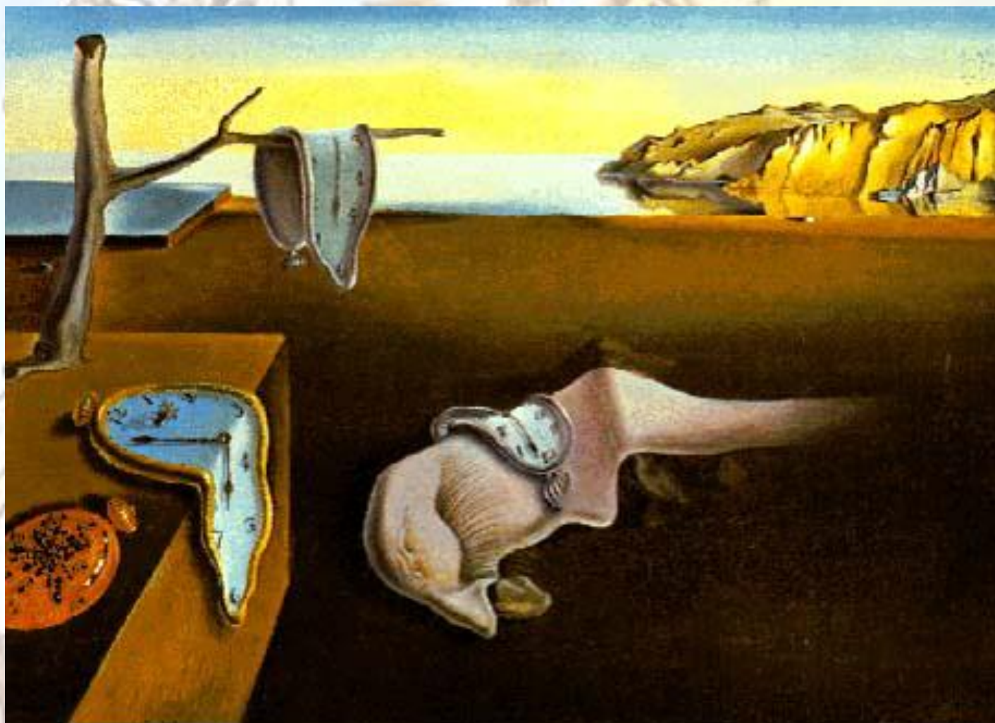
A persistência da memória - Salvador Dalí Museu de Arte Moderna, Nova York - (XX)