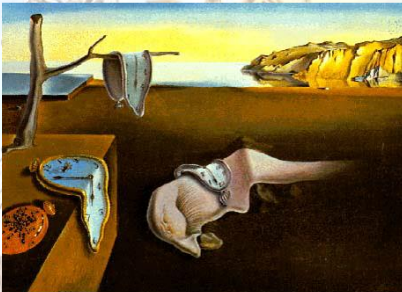
A persistência da memória - Salvador Dalí Museu de Arte Moderna, Nova York - (∞)